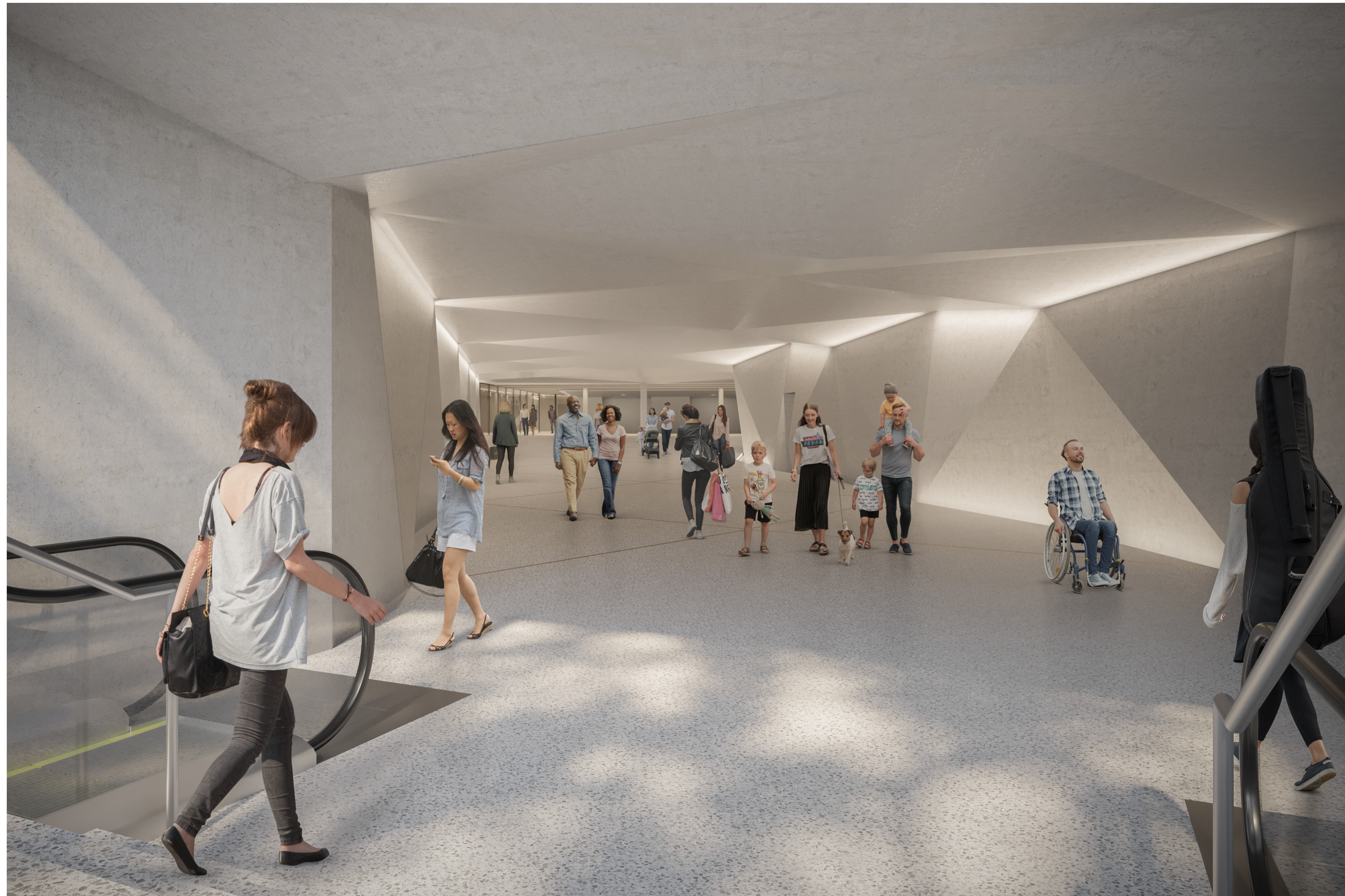
© Nightnurse Images Zürich, im Auftrag des Tiefbauamtes der Stadt Bern

TAB Nr. 114 000 ING. Nr. 22H89/209-8 LV 03 LV 95